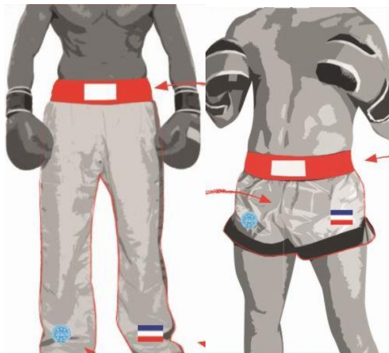
Low-Kick und K1-Style